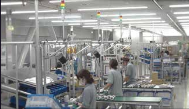
สายการผลิต